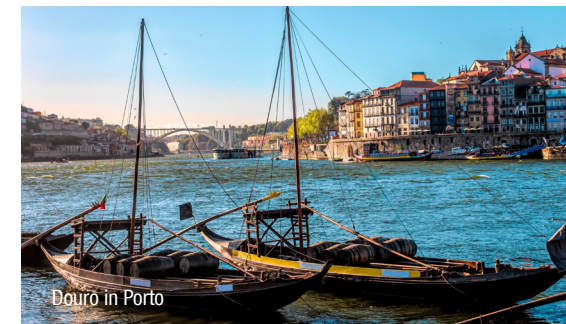
Douro in Porto