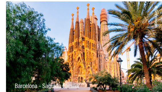
Barcelona - Sagrada Família