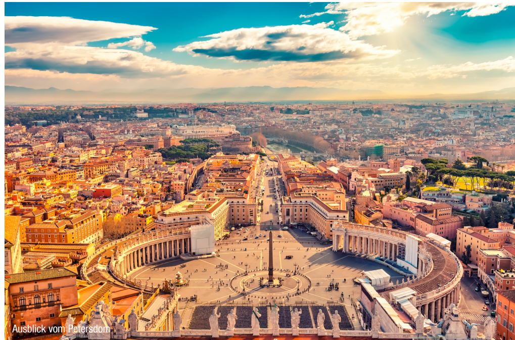
Ausblick vom Petersdom

Genießen Sie erholsame Tage an der Adria kombiniert mit kulturellen und kulinarischen Höhepunkten. Lernen Sie die Gegend rund um den Badeort Alba Adriatica kennen und besuchen Sie die italienische Hauptstadt Rom bei einem Tagesausflug!