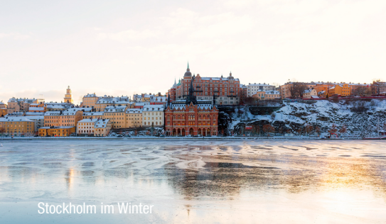
Stockholm im Winter