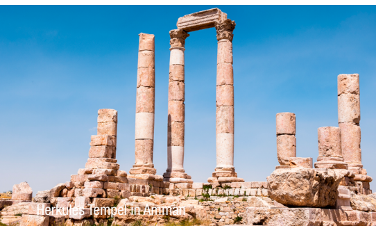
Herkules Tempel in Amman