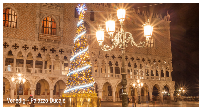
Venedig - Palazzo Ducale

Erleben Sie das vorweihnachtliche Jesolo mit seinem stimmungsvollen Weihnachtsdorf, genießen Sie venezianisches Flair auf dem Markusplatz und entdecken Sie die zauberhafte Sandkrippe von Lignano. Zum krönenden Abschluss besuchen Sie die festlich geschmückte „Stadt der Liebe“ Verona.