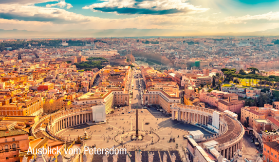
Ausblick vom Petersdom