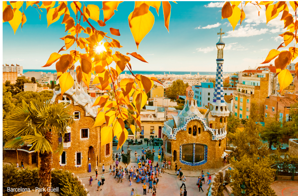
Barcelona - Park Güell

Besuchen Sie die angesagteste Stadt Europas: Erleben Sie die bunt-verspielten Bauwerke Gaudis und genießen Sie das ausgelassene Treiben in den Ramblas bei einer ausgiebigen Shoppingtour - lassen Sie sich von der spanischen Lebensfreude und den kulturellen und kulinarischen Höhepunkten Barcelonas verzaubern!