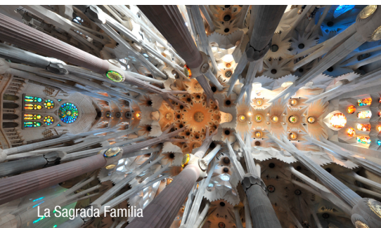
La Sagrada Família