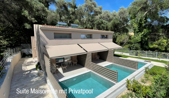
Suite Maisonette mit Privatpool