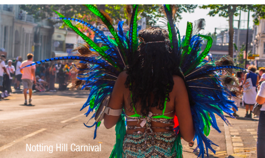
Notting Hill Carnival

Lassen Sie sich vom Charme dieser einmaligen Metropole begeistern, wandeln Sie auf den Spuren der Monarchen, besuchen Sie renommierte Kunstmuseen und gehen Sie auf Shoppingtour. Eine Reise in die pulsierende Weltstadt verspricht eine einzigartige Mischung aus trübeligen Plätzen, bunten Schaufenstern, englischen Gärten und noblen Villenvierteln!