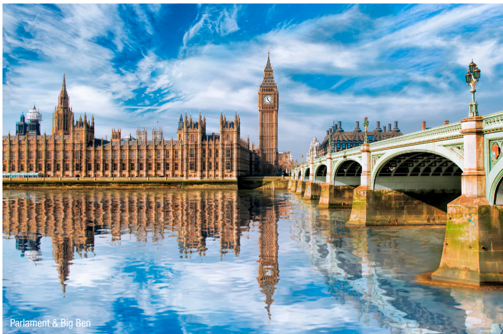
Parlament & Big Ben