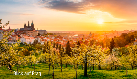
Blick auf Prag