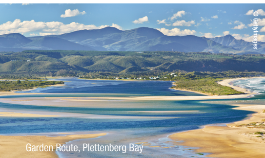
Garden Route, Plettenberg Bay