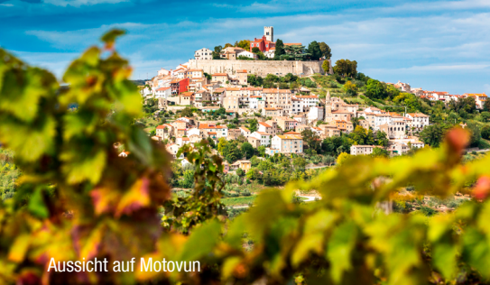
Aussicht auf Motovun