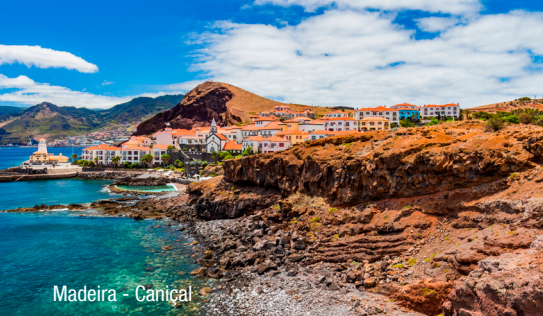
Madeira - Canical