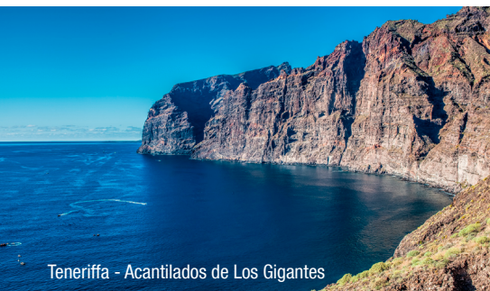
Teneriffa - Antilados de Los Gigantes