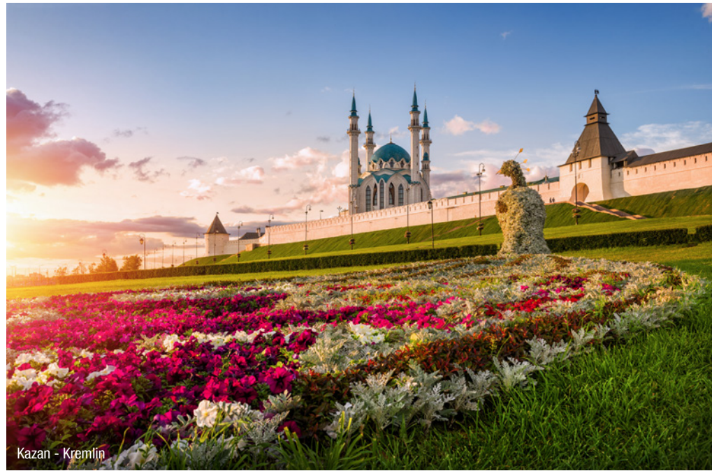
Kazan - Kremlin

Diese Flusskreuzfahrt führt Sie auf dem längsten Fluss Europas vom Roten Platz in Moskau bis nach Astrachan am Kaspischen Meer, eine ca. 3.000 km lange Reise entlang einer außergewöhnlichen Route. Unterwegs lernen Sie die bedeutendsten Städte an der Wolga kennen, während Sie an Bord der MS Tchaikovski ausgesuchte Spezialitäten und ein exquisites Unterhaltungsprogramm genießen.